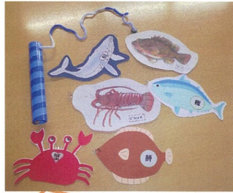
魚釣りゲーム 高梁城南高校の生徒さんより戴きました。