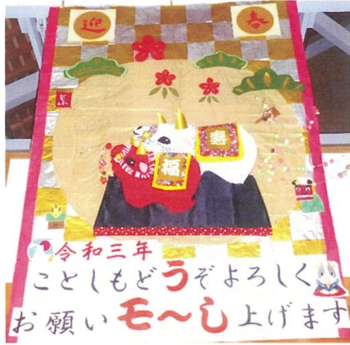
1月の壁画「丑年で〜す」